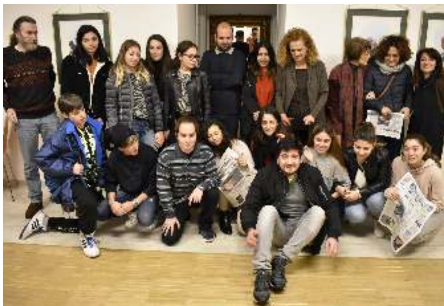
Foto di gruppo tra sorrisi e giornali

I laboratori di lettura hanno rappresentato per tutti noi un momento, oggi giorno raro, di sereno scambio e confronto di idee che, attraverso la pluralità dei punti di vista, garantita dall'appartenenza dei partecipanti a fasce di età diverse e dalle loro personali esperienze, ha spesso animato interessanti dibattiti.