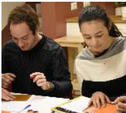
La ricerca dei titoli "bollenti"