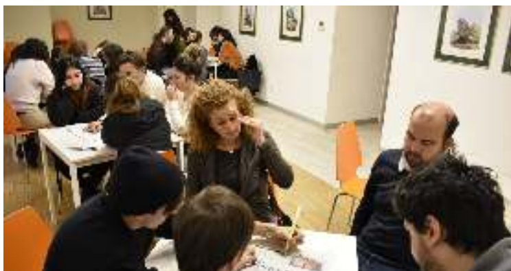
I gruppi al lavoro nella sede di Sinergie Solidali