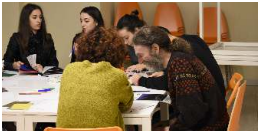
Di tutto un po': i laboratori fotografati in vari momenti di attività