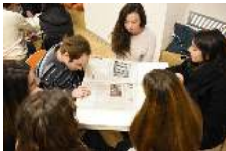
Letture del giornale e selezione delle notizie più importanti