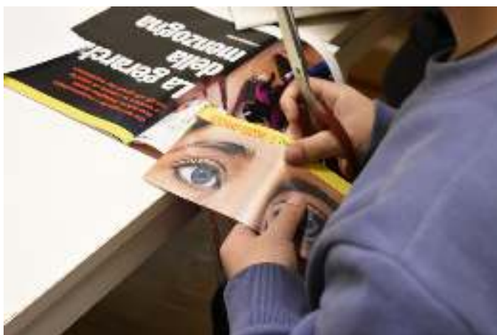
Selezione di frasi o titoli o parole significative

Proponiamo una selezione di frasi raccolte durante la lettura dei giornali avvenuta negli ultimi due incontri. Parole e riflessioni condivise che ci sono sembrate particolarmente significative. Le abbiamo lasciate così senza commento, perché anche da sole parlano di noi e dicono molto della sensibilità di chi le ha scelte