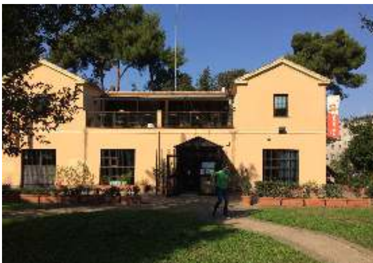
La Biblioteca Comunale all'interno di Villa Leopardi

La trama sotterranea della catacombe, è stata in un restauro recente proiettata in superficie con un parterre di rose rosse, rapidamente smantellato dopo l'inaugurazione, per un raptus fulminante di cleptomani collettiva del pubblico.